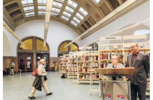
Hell und luftig: Die modernisierte Heinrich-Schulz-Bibliothek steht Nutzern seit der Wiederinbetriebnahme durch Stadträtin König und Hubert Kolland wieder offen.

Charlottenburg. Platz für Noten, wohnlichere Flächen für Zeitungsleser und bessere Klimatisierung für kühle Köpfe: Im Rathaus Charlottenburg lässt es sich nach einer wochenlangen Erneuerung der Bücherei endlich genussvoll schmökern. Dabei hieß es vor nicht allzu langer Zeit, das Angebot solle von hier verschwinden.