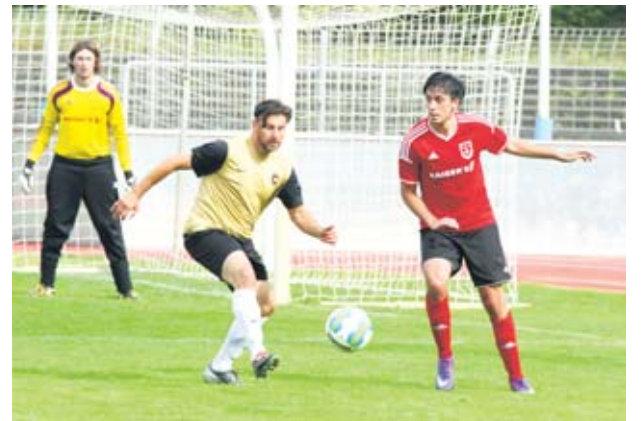
Der SC Charlottenburg (goldene Trikots) kam im Heimspiel gegen den BSC Eintracht Südring nicht über ein 2:2-Remis hinaus.

Westend. Die Fußballer vom SC Charlottenburg haben am dritten Spieltag der Fußball-Landesliga im Heimspiel gegen den BSC Eintracht Südring zwei Punkte liegen gelassen: Gegen die Truppe aus Kreuzberg kam der SCC trotz zahlreicher hochkarätiger Torchancen nicht über ein 2:2 (2:1)-Remis hinaus.