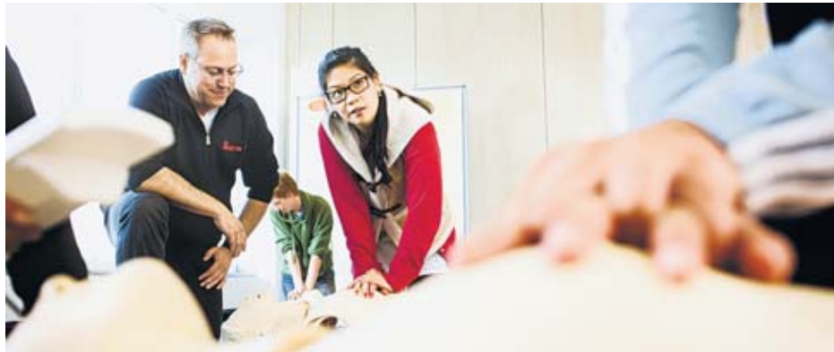
Herz-Druckmassage und Beatmung: Die Erste-Hilfe-Kenntnisse sollten regelmäßig aufgefrischt werden.