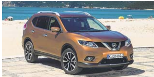
Der Nissan X-Trail ist ab 26 790 Euro erhältlich.

Trotz eines leicht rückläufigen Pkw-Gesamtmärkts ist Nissan die wachstumsstärkste Marke in Deutschland. Kunden lieben den Stadtflyer Note, auch der zum Jahresanfang eingeführte neue Qashqai erfreut sich großer Nachfrage.