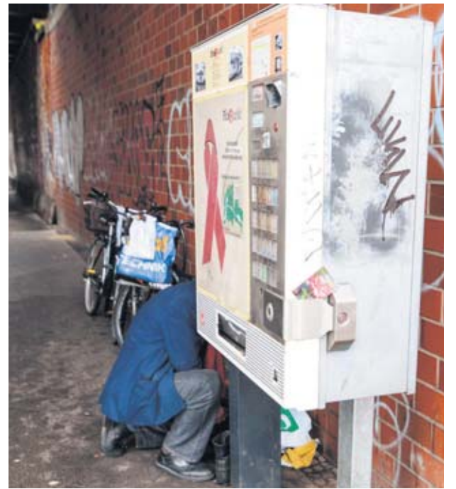
Brennpunkt Stutti: Vor allem an den Eingängen zur U7 agiert seit Jahren eine Drogenszene, die weite Teile Berlins mit Heroin versorgt.