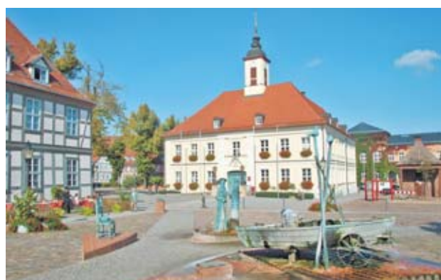
Das Rathaus am Markt von Angermünde gehört zu den Sehenswürdigkeiten der Stadt.

Im Mittelalter hatte Angermünde nicht den besten Ruf. Den verließen ihr schon im 14. Jahrhundert Franziskanermonche, die 1336 einen Ketzlerprozess gegen die sogenannten Waldenser betrieben, in dessen Folge 14 Menschen auf dem Angermünder Markt öffentlich verbrannt wurden. Der Pferdehändler Michael Kohlhaas soll dort vor fast 500 Jahren jene Rösser gekauft haben, die ihm später gestohlen wurden. Ein gewisser Schuhmacher Wilhelm Voigt saß lange vor seiner Karriere als Hauptmann von Köpenick in Angermünde im Gefängnis, weil er eine Postanweisung gefälscht hatte. Jene Taten sind inzwischen vergessen, die historische Altstadt erinnert aber noch heute an die wechselvolle Geschichte von Angermünde.