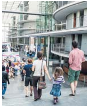
Auch das Paul-Löbe-Haus kann besichtigt werden.

Geboten wird ein abwechslungsreiches Programm mit Diskussionen, Führungen, Ausstellungen, Musikauftritten, Kinderaktionen und vieles mehr. Bei einem Rundgang durch das Reichstagsgebäude können Räume besichtigt werden, die sonst nur von Abgeordneten des Bundestages genutzt werden. So kann der Plenarsaal besichtigt werden. In der Abgeordnetenlobby würdigt eine Ausstellung einen ganz besonderen Anlass: Genau vor 65 Jahren kam der erste Deutsche Bundestag zu seiner konstituierenden Sit-